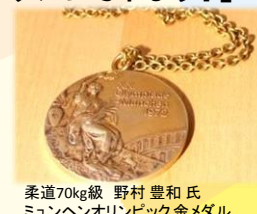
柔道70kg級 野村豊和氏 ミュンヘンオリンピック金メダル