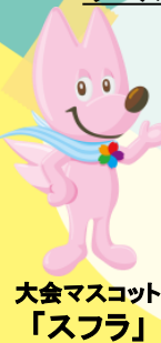
大会マスコット 「スフラ」

2021年 世界最高峰の生涯 スポーツの祭典ワールドマ スターズゲームズが関西広 域で開催され、35競技59種 目の開催が決定しています。 開催期間: 2021年5月14日~30日