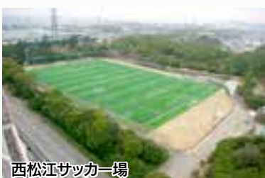
西松江サッカー場

河西公園、松江緑地、湊緑地にテニスコート2面、河西プール、西松江緑地体育館、野球場、サッカー場、多目的運動場、ソフトボール場があり様々なスポーツを楽しむことができます。