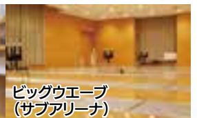
ビッグウエーブ (サブアリーナ)