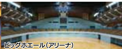
ビッグホエール(アリーナ)