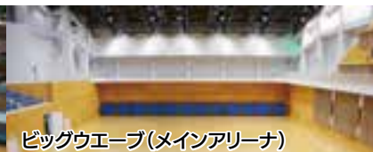
ビッグウエーブ(メインアリーナ)