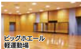
ビッグホエール 軽運動場