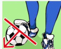
【インサイドキック】

インサイド（足の内側）は接触面が広く、ボールを蹴るときに、正確にボールを蹴りだすことができます。