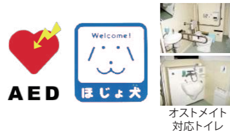
オストメイト 対応トイレ